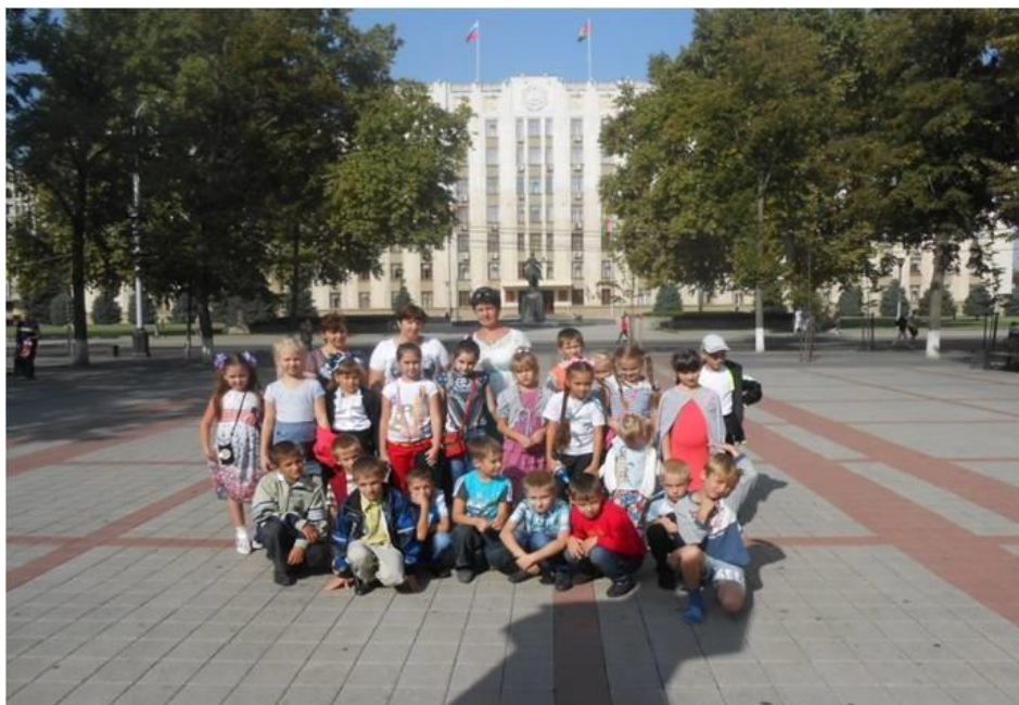
Рис.4. Экскурсия в Краснодар

Для младших школьников основными орудиями воспитания служат семья, школа и дополнительное образование. Именно такое сотрудничество и лежит в основе внеурочной деятельности «Кубанское подворье», которые я провожу по авторской программе по финансовой грамотности младших школьников, ставшей победителем всероссийского конкурса. Ужесточение Западом введённых санкций оказали негативное влияние на финансовую систему нашей страны. Государством разрабатываются программы по повышению финансовой грамотности населения, большое внимание уделяется развитию всех областей сельского хозяйства для обеспечения граждан собственными продуктами, отказа от импорта тех видов продукции, которую можно вырастить самим. И, если проблема финансовой грамотности касается всех граждан нашей огромной страны, то вторая приоритетная задача стоит, прежде всего, перед жителями сельских регионов. Мы живём в одном из самых благодатных уголков нашей страны – Краснодарском крае. Недаром его издавна называют «житницей России». Называют заслуженно, потому что каждая десятая буханка хлеба выпекается из кубанского зерна. Поэтому, кому как не нам, жителям Кубани, необходимо приложить все усилия для того, чтобы государственные программы по импортозамещению были выполнены. А решение этого вопроса неразрывно связано с финансовой грамотностью людей, работающих на земле.