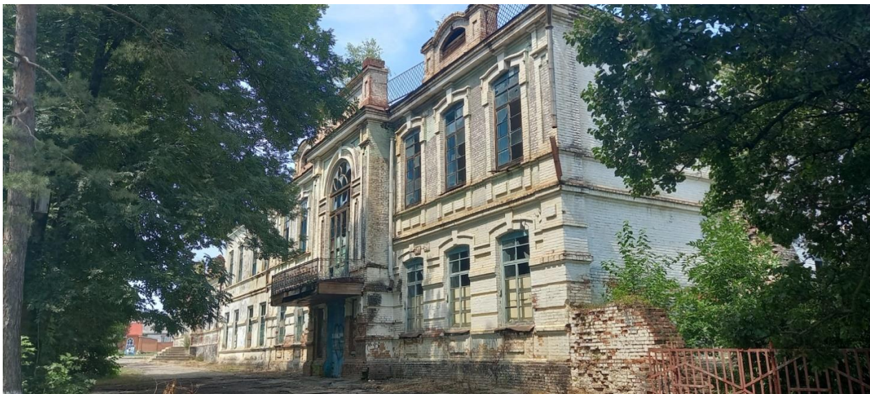
Рис. 1. Бывшее здание Ярославского двухклассного училища (ст. Ярославская, ул. Школьная, 21)

шая его с находящимся поблизости бывшим женским училищем [46; 47]. На сегодняшний день корпуса учебных заведений, по сути, составляют единый архитектурный комплекс, но «историческую» границу между ними можно легко заметить невооружённым глазом (рис. 1).