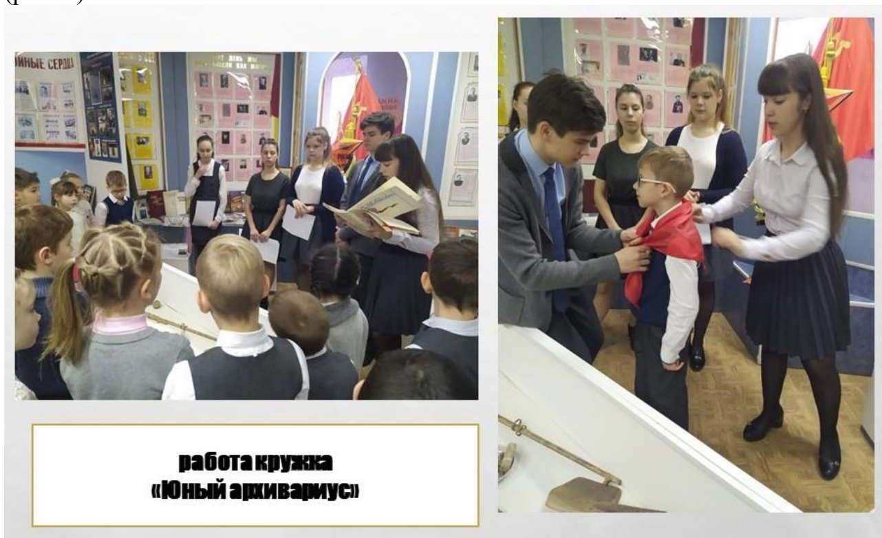
Рис.2 МОБУГ 2 им. И.С. Колесникова г. Новокубанска, 2022, работа кружка «Юный архивариус»

изучив научную литературу о нем. Обучающиеся обращаются к заинтересовавшему их экспонату, проводят внешнюю и внутреннюю его критику (внешняя критика: определение даты и место происхождения, автор источника, подлинность материала на котором написан источник, почерка и других палеографических данных, печатей, гербов, прямые указания в тексте источника; внутренняя критика: выяснение достоверность фактов, заключенных в источниках путем умозаключений), а уже затем обращаются к определению тематики исследования и всей структуре исследования. В гимназии музейная педагогика применяется в рамках курсов кружковой и внеурочной деятельности: «Юный архивариус», «История и культура кубанского казачества», «История и современность кубанского казачества», «Традиционная культура кубанского казачества» и др. (рис. 2).