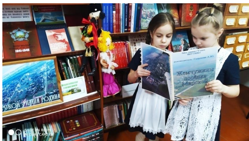
Рис. 3. Путеводитель по поселку «Пройдись по улицам Мирского»

Исследовательская работа интересна для учащихся младших классов. С удовольствием ребята готовят материалы к занятиям, беседуют со старожилками поселка, работают с экспонатами школьного музея. «Участие людей всех возрастов в такого рода собирании краеведческого материала имеет само по себе огромное воспитательное значение. Оно есть уже одной из акций патриотического характера, создающая в своем крае более высокий уровень духовной культуры», – писал академик Д.С. Лихачев. [2, с.160] И этому есть подтверждение. В рамках краевого конкурса «Жемчужины Кубани» мы подготовили материал о нашем поселке, где не только рассказали о нем, но и показали его достопримечательности. Эта работа полностью увлекла детей. Они с энтузиазмом собирали материал о своей малой родине. Нами был издан путеводитель по поселку «Пройдись по улицам Мирского», который занимает теперь почётное место в нашей школьной библиотеке (рис.3).