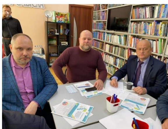
Рис. 2, 3. Стратегическая сессия «Стратегия социально-экономического развития МО Новокубанский район до 2030 года», г. Новокубанск, 2022 г.