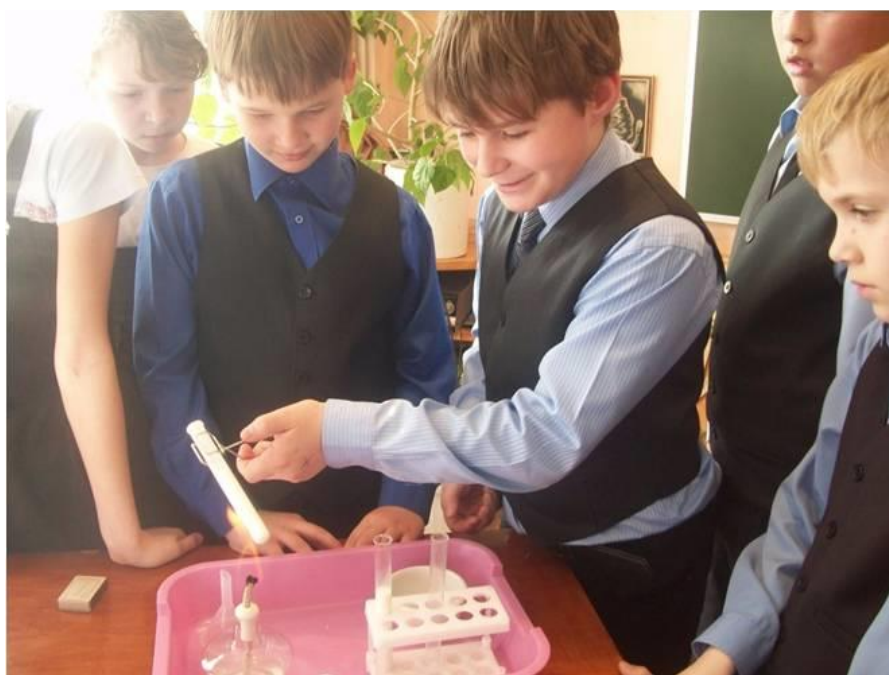
Рис.5. Изучаем состав молока

С особым интересом посещаем торговые предприятия: изучаем их ценовую политику в условиях конкуренции; составляем наборы продуктовых корзин для потребителей различных категорий; сопоставляя возможности и потребности, учимся оценивать собственные экономические действия в качестве потребителей. Не забываем и о том, что продукты, которые мы употребляем, должны быть экологически чистыми, качественными. С большим интересом проводим опыты и тестирование продуктов питания, учимся определять их сроки годности, наличие в них консервантов и красителей (рис.5).