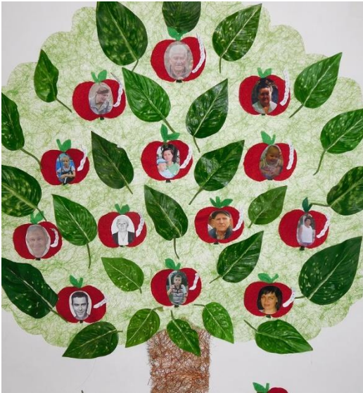
Рис. 1. Опыт использования элементов деятельностного подхода на уроках кубановедения, г. Армавир, 2023 г.

Серьезные учебные проекты с исследовательской составляющей мы с учениками начинаем выполнять уже во втором классе. Сезонный годовой исследовательский проект включает в себя фенологические наблюдения, творческие работы учащихся, анализ выборки небольших произведений кубанских писателей и поэтов, художников, изучение и отбор казачьих фольклорных произведений сезонной тематики. Это очень важная работа, помогающая получить уникальный опыт ребенку независимо от его особенностей и способностей.