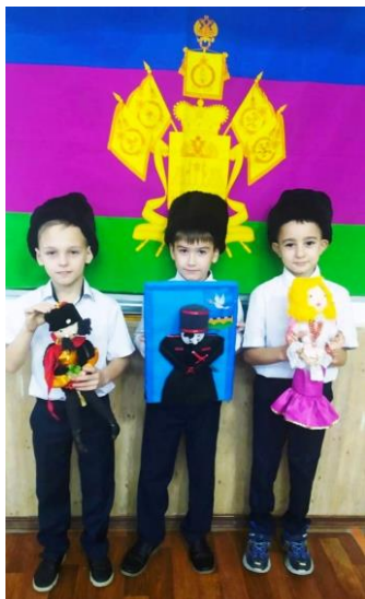
Рис. 1 Коллективно-творческое дело «Казачий костюм», МБОУ СОШ №15, Кавказский район

Проводим конкурсы, встречи и экскурсии, работаем в тесном школьном гостем наставник интересно настоятелем